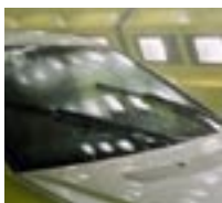
Winter-Extremtest: Im weltweit größten Klima-Windkanal wurden die neuen Mercedes-Benz Aero- Scheibenwischer getestet, die auch unter Extrem-Bedingungen absolut überzeugen.